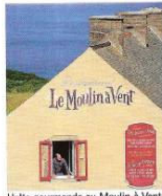
Halte gourmande au Moulin à Vent.