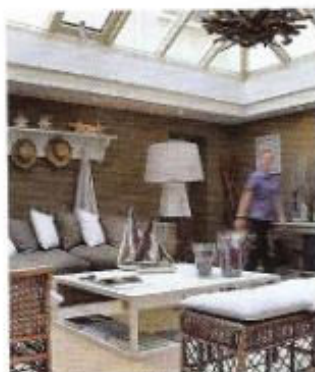
Face à la mer, le bel Hôtel des Isles.

■ Office du tourisme de La Hague, Beaumont- Hague. Tél. : 02.33.52.74.94. www.lahague.org.